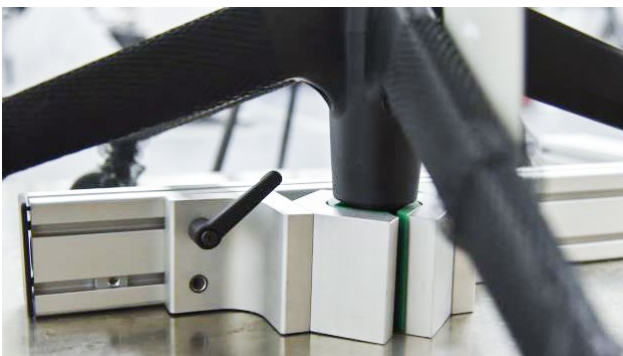
Prisma für Prüfobjektfixierung | Prism for test object fixation

The measurements of the angles are carried out electronically with the help of high-precision electronic angle gauges. All test steps to be performed are output in compliance with the standard on the touch display and the electronically recorded measured values are automatically entered in.