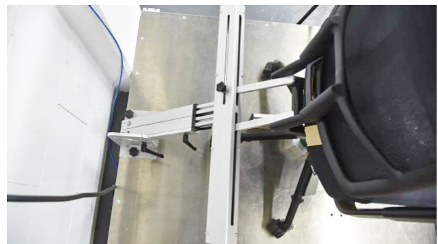
Ausrichtungszangen für Objektausrichtung | Alignment piers for object alignment