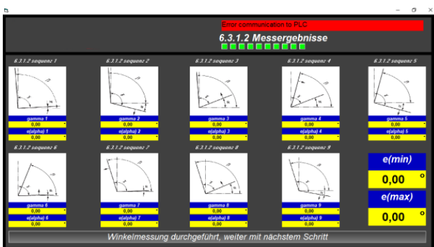
Automatische Messung der Winkel | Automatic measurement of the angles